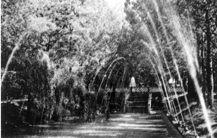
Рис. 3. Фонтани у парку ім. Т. Шевченка у Рівному Джерело ілюстрації: листівка 1968 р. Фото І. Кропивницького

У деяких містах, в основному зосереджених на теренах Західної України, у зв'язку з відсутністю значних руйнувань під час Другої світової війни, планувальна структура центрів зберігала свій вигляд, а вулична мережа залишалася незмінною. Згідно з новими генеральними планами, в таких містах як Львів, Чернівці, Ужгород, Івано-Франківськ , основна увага зосереджувалася на озелененні території, встановленні малих архітектурних форм та інших заходів з благоустрою. Так, наприклад, в Івано-Франківську на місці зруйнованої в роки війни забудови в центральному районі міста було влаштовано бульвар.