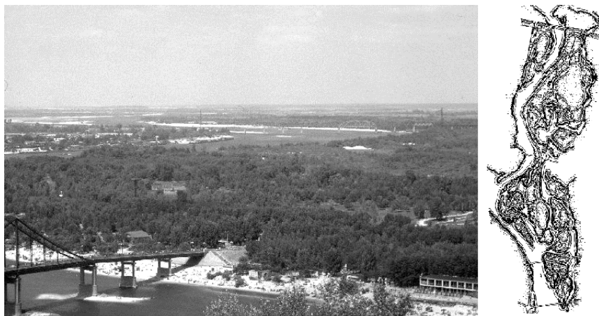
Рис. 1. Гідропарк на Трухановому острові у Києві. Загальний вигляд у 1960-х рр. та проєкт планування 1945 р.

Пропозиції щодо розв'язання проблем озеленення Харкова було розроблено ще у довоєнному генеральному плані (1936 р). У 1948 р. було створено новий генеральний план міста, згідно з яким і відбувався подальший розвиток системи зелених насаджень [3, С. 421–422]. Так, в центральній частині міста у повоєнні роки здійснювалася реконструкція парку ім. М. Горького [12], ботанічного саду ХНУ ім. В. Н. Каразіна [13] та міського саду ім. Т. Шевченка, розташованого біля площі Свободи.