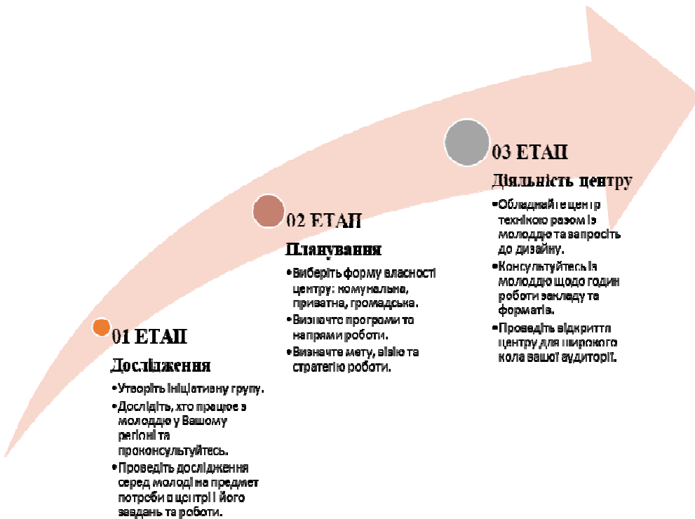
Рис. 2. Етапи створення молодіжного центру

Використання кращих європейських практик розвитку молодіжної політики прискорить створення належних інституційних та економічних умов для самореалізації молоді у громадах. Запропоновано створювати та розвивати молодіжні центри у сільських територіальних громадах, використовуючи досвід Європейського керівного комітету у справах молоді щодо видання знаків якості для молодіжних центрів, адаптувавши його у певну модель добровільної сертифікації таких центрів, що може бути пов'язане їх подальшою ресурсною підтримкою.