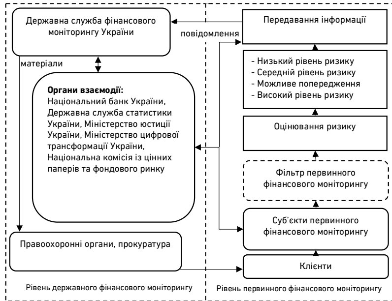
Рис. 2. Система функціонування фінансового моніторингу на первинному і державному рівні на основі ризик-орієнтованого підходу

Закон України «Про запобігання та протидію легалізації (відмиванню) доходів, одержаних злочинним шляхом, фінансуванню тероризму та розповсюдження зброї масового знищення» [8] визначає основні положення щодо порядку відстеження підозрілих фінансових операцій або діяльності, процедури подання інформації суб'єктами первинного фінансового моніторингу (СПФМ) до спеціального уповноваженого органу державного моніторингу. Проте, в умовах воєнного стану, коли посилюється увага до походження коштів, які можуть бути отримані незаконним шляхом, або бути пов'язаними із фінансування терористичних дій держави-агресора, діяльність у сфері фінансового моніторингу повинна бути адаптована до сучасних реалій та включати нові інструменти.