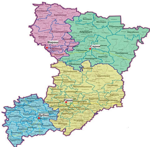
Рис. 1. Адміністративно-територіальний поділ Рівненської області (побудовано авторами на основі джерел [1])

17 липня 2020 року Верховною Радою України було прийнято Постанову № 3650 «Про утворення та ліквідацію районів». Згідно з цим документом, на Рівненщині замість 16 районів утворено 4 (рис. 1).