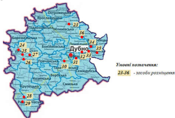
Рис. 4. Розташування КЗР на території Дубенського району (побудовано авторами)

В Дубенському районі 14 колективних засобів розміщення. Більшість засобів розміщення надають інформацію про свої послуги на власній сайтах, у спільнотах популярних соціальних мереж і через відомі системи інтернет-бронювання житла, окрім 5 об'єктів. Зірковість присвоєна двом готелям – «Троянда» і «Фермерська хата» (рис. 4).