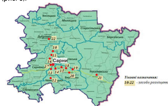
Рис. 3. Розташування КЗР на території Сарненського району (побудовано авторами)