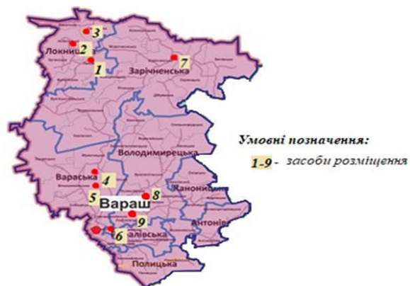
Рис. 2. Розташування КЗР на території Вараського району (побудовано авторами)