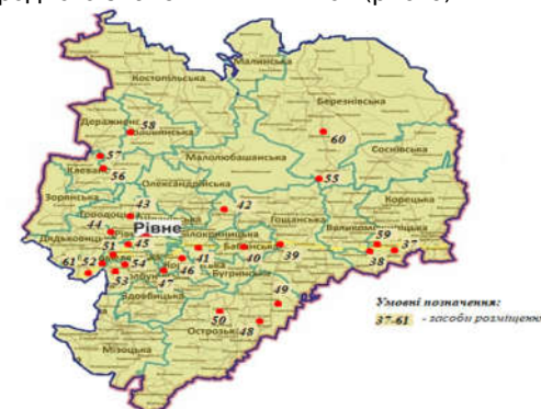
Рис. 5. Розташування КЗР на території Рівненського району (побудовано авторами)

Основна частина колективних засобів розміщення у Рівненському районі зосереджена уздовж автомобільного шляху М 06 міжнародного значення Київ – Чоп (рис. 5).