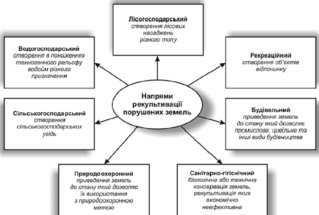
Рис. 2. Напрями рекультивації порушених земель [4]

Проведемо класифікацію порушених земель для рекультивації: «...порушені території після комплексу відбудовних робіт використовуються для створення зон зелених насаджень загального й обмеженого користування, спеціального призначення; промислових зон і зон зовнішнього транспорту; житлових районів і мікрорайонів; зон водних регульовальних устроїв; рибо- і сільськогосподарських зон; зон водопостачання; комунально-складських зон тощо» [6]. Класифікація порушених земель залежно від напрямку подальшого використання подано в рис. 2.