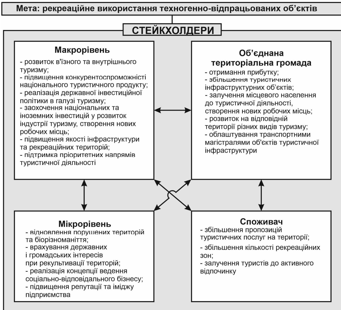
Рис. 4. Вигоди за проєктами рекультивації з метою рекреаційного використання техногенно-відпрацьованих об'єктів для різних груп стейкхолдерів