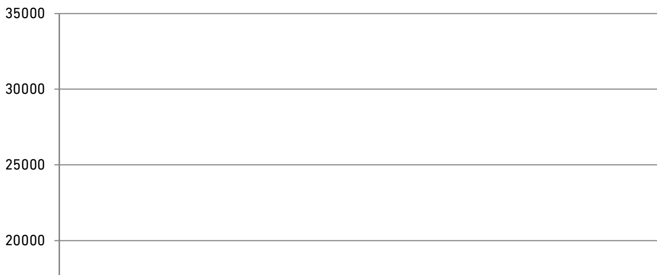
Рис. 3. Динаміка обсягів випусків облігацій підприємств протягом 2016–2020 рр. [4]