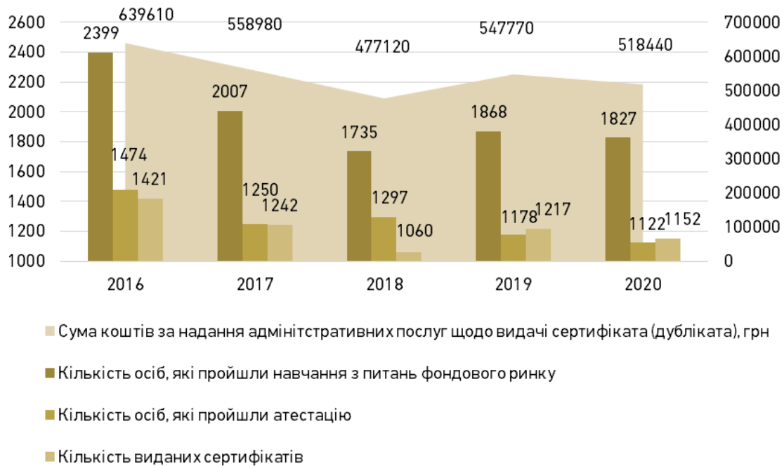
Рис. 4. Показники підготовки фахівців з питань фондового ринку [9]

Це може свідчити про певну незмінність ринку фахівців з питань фондового ринку, що, на нашу думку, є скоріше негативним фактором, адже констатує своєрідній «застій» фондового ринку.