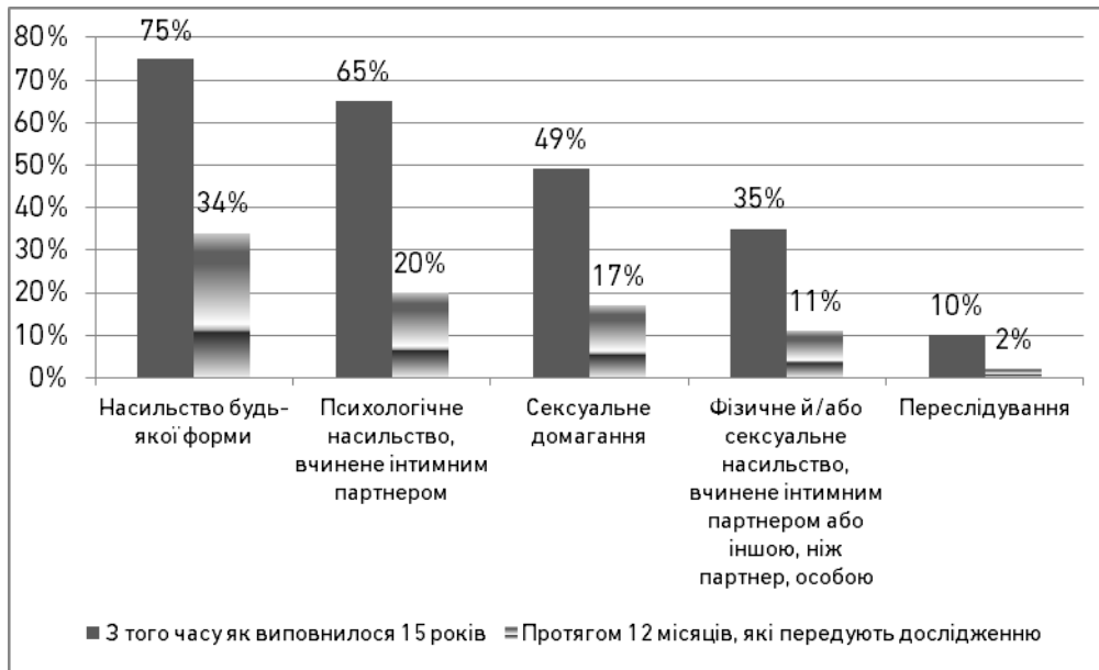
Рис. 1. Рівень поширення різних форм насильства над жінками

Фізичному чи/або сексуальному насильству піддавалась кожна третя жінка. При цьому приблизно чверть жінок в Україні вважає, що домашнє насильство – це особиста справа й має вирішуватись у межах сім'ї (26%). Це вище за середній показник в Європейському Союзі (14%), але нижче за показник сусідньої Румунії (31%). У країнах ЄС показник згоди з таким твердженням варіюється від 2% у Швеції до 31% у Румунії [9]. Це свідчить про існування певних гендерних стереотипів в окремих країнах, а також про те, що у країнах з високим рівнем інформаційної політики щодо питань гендерної рівності жінки виявляють більше бажання говорити про домашнє насильство.