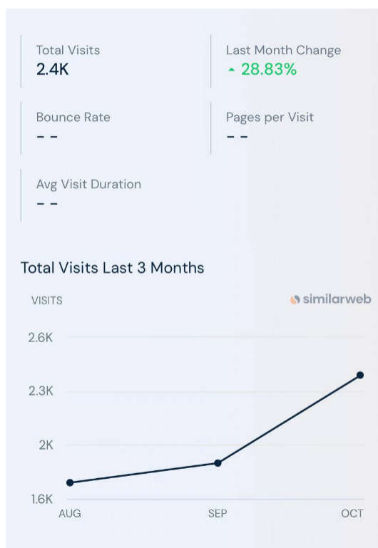
Рис. 3. Динаміка активності сайту за 3 місяці [11]

З аналізу сайту можна зробити висновок, що загальна кількість відвідувачів сайту зростає, а динаміка є позитивною. За останній місяць кількість відвідувань сайту зросла на 28,83%, а це свідчить про те, що на підприємстві вдале інноваційне впровадження та завод має конкурентоспроможність на вітчизняному ринку. Порівнюючи з «Пригощайся», можна зробити висновок, що відвідуваність сайту «Пригощайся» є значно вищою – 63,4 тис., тоді як в «Родини» всього 2,4 тис., проте в останній місяць показники підприємств знаходяться майже на однаковому рівні: 28,64% у «Пригощайся» та 28,83% у «Родини», це вкотре нам показує, що заводи мають позитивну динаміку та впевнено розвивають свої бренди.