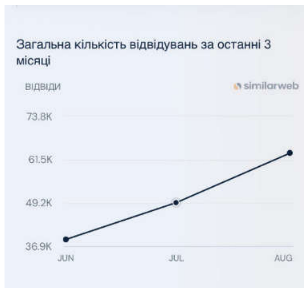
Рис. 1. Динаміка активності сайту за 3 місяці [11]

З аналізу сайту можна зробити висновок, що загальна кількість відвідувачів сайту зростає, та динаміка є позитивною.