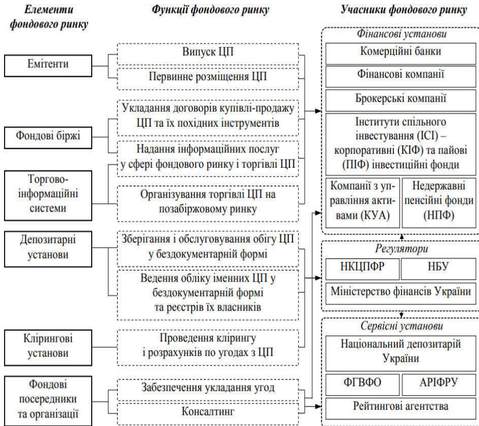
Рис. 1. Об'єкти регулювання фондового ринку України [2]

За 2021 рік Національна комісія з цінних паперів та фондового ринку зареєструвала 86 випуск акцій на суму 42,9 млрд грн, які наведені в таблиці. Якщо порівняти цей показник з періодом за 2020 та 2019 роки, то можна побачити, що обсяг зареєстрованих випусків акцій відповідно збільшився на 9,9 млрд грн і зменшився на 20,6 млрд грн. Проаналізувавши, ми бачимо, що за 3 досліджувані роки кількість акцій збільшилася у загальному на 8 випусків, але при цьому обсяг зменшився на 20,9 млрд грн. Вважаємо, що таким чином ринок оздоровлюється. Також у 2021 році Комісія зареєструвала 113 випусків облігацій підприємств на суму 10,0 млрд грн. Якщо порівняти цей показник з торішніми, то ми бачимо, що кількість випусків облігацій підприємств збільшилася на 17 у порівнянні з 2020 роком, та на 25 у порівнянні з 2019 роком. Якщо порівнювати обсяг випусків облігацій, то проти 2020 обсяги впали втричі, а якщо порівнювати з 2019 роком можна сказати, що вони залишилися на місці.