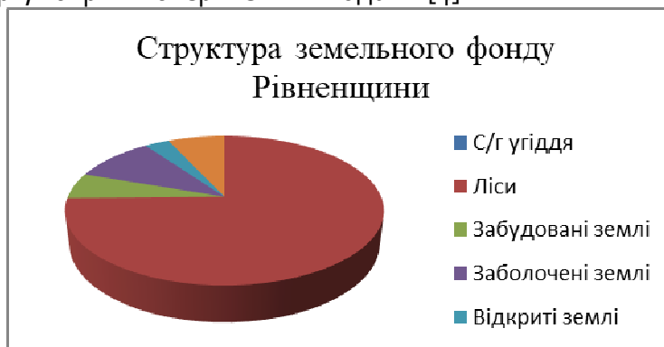
Рис. 1. Структура земельного фонду Рівненської області (побудовано за даними [4])

Аналіз одержаних результатів. Рівненська область знаходиться в північно-західній частині України. Площа Рівненщини сягає 20,1 тис. км 2 , що становить 3,3% від всієї площі України [4]. За даними головного управління Держземагентства в області, загальна площа земель області становить 2005,1 тис. га, з них 46,2% займають сільськогосподарські угіддя, 40,2% – ліси та інші лісовкриті площі, 3,0% – забудовані землі, 5,3% – відкриті заболочені землі, 1,6% – відкриті землі без рослинного покриву або з незначним рослинним покривом (піски, яри, землі зайняті зсувами, щебенем, галькою, великими скелями), 3,7% – інші землі, 2,2% – території, покриті поверхневими водами [4].