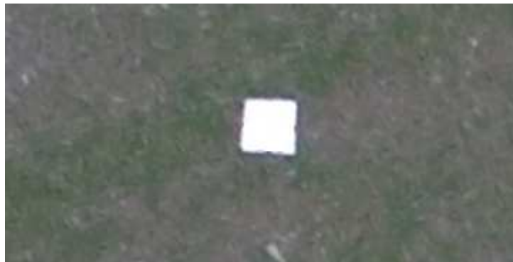
Рис. 2. Зображення маркера розміром 50x50 см

У якості планово-висотних опознаків можуть використовуватись чіткі контури та об'єкти місцевості. У випадку відсутності таких об'єктів безпосередньо перед виконанням знімання необхідно розкласти штучні маркери, форма, розмір і колір яких дозволить точно ідентифікувати їх на знімках і використати для геодезичної прив'язки.