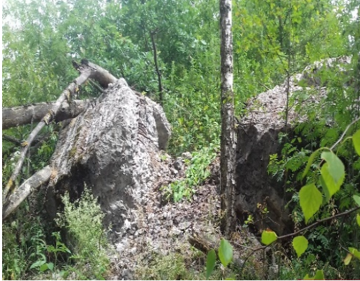
Рис. 2. Бетонні елементи зруйнованого ДОТа в урочищі «Косий місто»