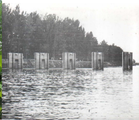
Рис. 3. Проміжні бики регульовального шлюза на р. Случ

Це і було використано інженерами-гідротехніками. Шлюз на р. Случ дозволив акумулювати річковий стік, направити його за необхідності на заплаву, далі каналом на заболочену територію Залив (рис. 3). Нині для місцевого населення це заповідне водноболотне мисливське господарство. Далі через невеликий шлюз вода потрапляла у систему річки Любонька, озеро Сомине – болота р. Льва. Таким чином створювалось непрохідне для техніки і напівпрохідне для піхоти болото, яке без плавзасобів подолати було неможливо.