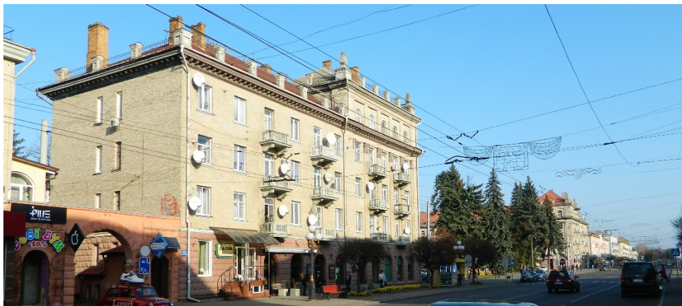
Рис. 2. Житлові будинки, Луцьк, Проспект Волі, 11 та 15