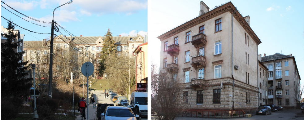
Рис. 1. Житловий будинок, Тернопіль, вул. Князя Острозького, 39/45