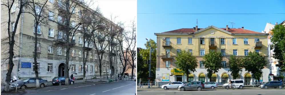
Рис. 6. Житлові будинки, Івано-Франківськ, вул. Вовчинецька, 4 та вул. Незалежності, 81

Чотириповерховий житловий будинок за адресою вул. Незалежності, 81 має симетричне П-подібне планувальне рішення. На торцях містяться еркери. Також яскраве втілення характерних стилістичних рис радянського неоісторизму представляє п'ятиповерховий будинок за адресою вул. Вовчинецька, 4 (рис. 6).