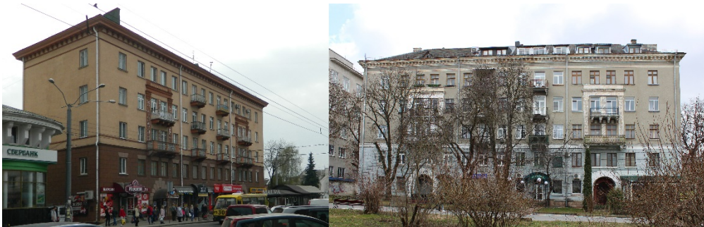
Рис. 4. Втілення житлового будинку за типовим проєктом у Рівному (вул. Соборна, 135) та Тернополі (вул. Чорновола, 2)

За проектом повторного застосування в другій половині 1950-х рр. у Рівному зведено «парадний» за своїм архітектурним рішенням п'ятиповерховий житловий будинок за адресою вул. Соборна, 135. За цим же проектом було споруджено житловий будинок у Тернополі (вул. Чорновола, 2), який увійшов до центрального архітектурного ансамблю міста. Втілення проєкту у Рівному та Тернополі мають незначні відмінності в декоруванні та опорядженні фасадів (рис. 4).