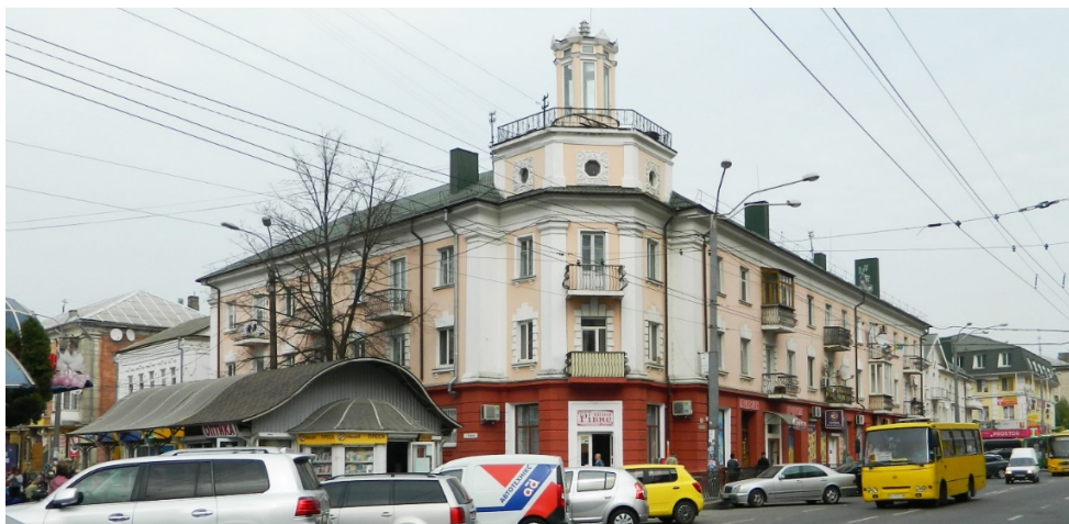
Рис. 3. Житловий будинок, Рівне, вул. Соборна, 262

Взірець житлового будинку з «вежею» на наріжній ділянці у Рівному – триповерховий житловий будинок з ротондою на даху, за адресою вул. Соборна, 262 (рис. 3). Будинок зведений за індивідуальним проєктом (арх. – Б. Андрєєв). Будівлю завершує декоративний ліхтар у вигляді ротонди з колонами [6, С. 118]. Цей будинок є архітектурним акцентом кварталу, який окреслюють вул. Соборна, вул. Базарна, вул. Гетьмана Полуботка та вул. Пересопницька. Окрім названого будинку, до складу кварталу ввійшли збудовані у 1945–1950-х рр. триповерхові житлові будинки за адресами вул. Соборна, 260 та вул. Базарна, 8, а також збережені будівлі довоєнного періоду.