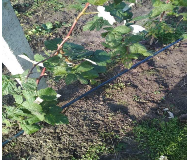
Фото 1. Малина сорту «Glen Ample» при крапельному поливі

на в чотирьох секторах. Система крапельного поливу, що застосована для поливу малини складається з магістрального трубопроводу діаметром 110 мм та розподільчого трубопроводів діаметром 75 мм, а також із крапельної стрічки «Ro-Drip».