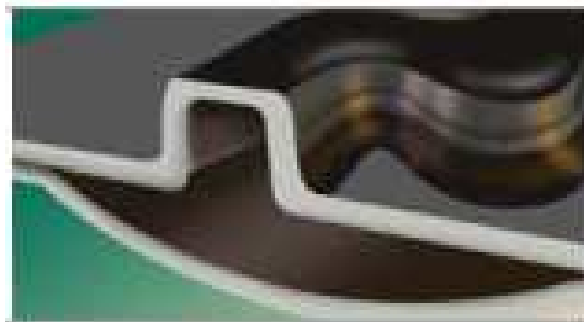
Фото 6. Додатковий захисний канал

• Промивний канал, що розширюється (фото 6). За екстремальних умов фільтрації води або відсутності фільтрації використовують унікальну технологію каналу, що розширюється (Expanding Flow Channel).