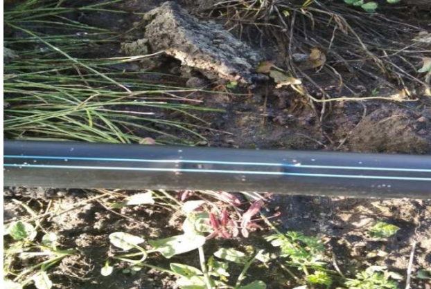
Фото 3. Крапельна стрічка «Ro-Drip» в роботі

Крапельна стрічка «Ro-Drip» забезпечує найбільше надійне і ефективно вирішення будь-яких зрошувальних задач при підземному і поверхневому зрошенні навіть при довжині стрічки, яка перевищує 400 метрів. Стрічка «Ro-Drip» – є єдиною крапельною стрічкою, спеціально розробленою для забезпечення рівномірного потоку і дозволяє вирішити одну із самих складних проблем в експлуатації – засмічення в умовах сильного забруднення.