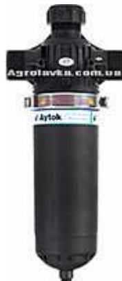
Фото 3. Дисковий фільтр для фільтрації води в системі крапельного поливу

В нашому випадку було підібрано дисковий фільтр. Конструкція дискового фільтру призначена для більш глибокого фільтрування. Складається з корпусу і фільтруючого елемента у вигляді набору щільно стиснутих тонких дисків з радіальними канавками. Вони поєднують надійність і найменшу собівартість обслуговування. Використовуються для видалення неорганічних і органічних частинок. Зазвичай використовуються при заборі води з свердловин. При засміченні можуть промиватися зворотним потоком води. Ступінь фільтрації 20-50-100-125 \mu\text{m} , площа фільтрації – 1805 \text{cm}^2 , максимальний робочий тиск — 8 bar, максимальна пропускна здатність: 50 \text{m}^3/\text{год} .