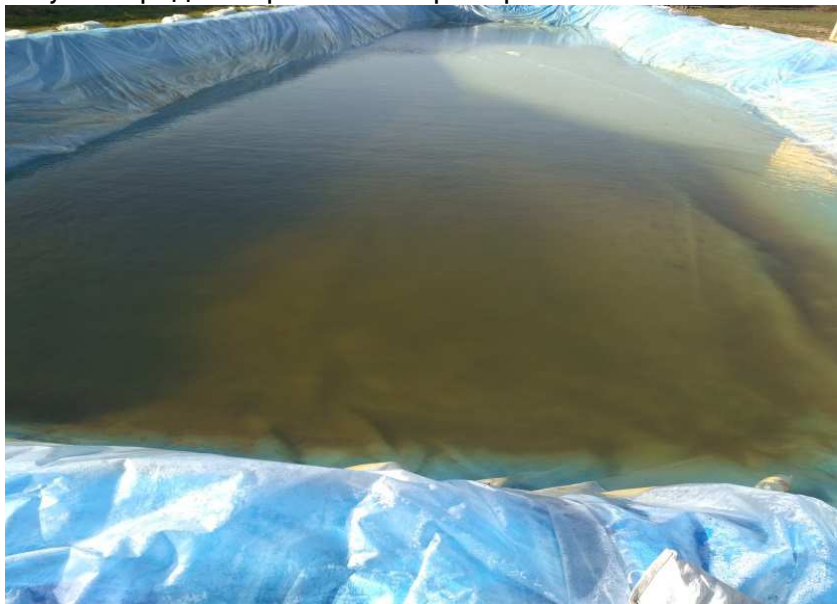
Фото 2. Басейн-відстійник

Джерелом водопостачання є свердловина з якої здійснюється забір води. Свердловина була пробурена ТОВ «ГЕОЛОГ ЛТГ» глибиною 95,0 м, робочим діаметром 93 мм і дебітом 5,4 м 3 /год, а також закріплена обсадними трубами. Експлуатаційними показниками свердловини є статистичний тиск, що становить 5,0 м, динамічний – 16,0 м при дебіті 5,4 м 3 /год. Відповідно до експлуатаційних рекомендацій було встановлено насос потужністю 6,0 м 3 /год. Глибину установки насоса можна змінювати у залежності від обсягу водоподачі, але не нижче 22,0 м [3]. Виходячи із рекомендацій було використано чотирьохтактну бензинову мотопомпу ТМ «Könner&Söhnen» з діаметром вхідної труби 80 мм. Вода яка забиралася із свердловини подавалася до заспокійливого басейну, який має розміри 60х20 м. Вода надійшовши до басейну відстоювалася та нагрівалася, а потім за допомогою аналогічної мотопомпи подавалася до системи крапельного поливу попередньо пройшовши фільтр очистки.