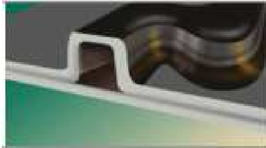
Фото 4. Прецизійна форма каналу

• Турбулентний потік (Vortex Flow Action) — протидіє засміченню системи шляхом призупинення руху рідини (фото 5). Турбулентний рух рідини в системі крапельного зрошення призупиняє частки бруду, сприяє подоланню кутів, викривлень і поворотів каналу. У результаті тверді частки безперервно вимиваються потоком води й не можуть закупорити канал.