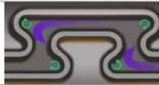
Фото 5. Система Vortex Flow Action

• Турбулентний потік (Vortex Flow Action) — протидіє засміченню системи шляхом призупинення руху рідини (фото 5). Турбулентний рух рідини в системі крапельного зрошення призупиняє частки бруду, сприяє подоланню кутів, викривлень і поворотів каналу. У результаті тверді частки безперервно вимиваються потоком води й не можуть закупорити канал.