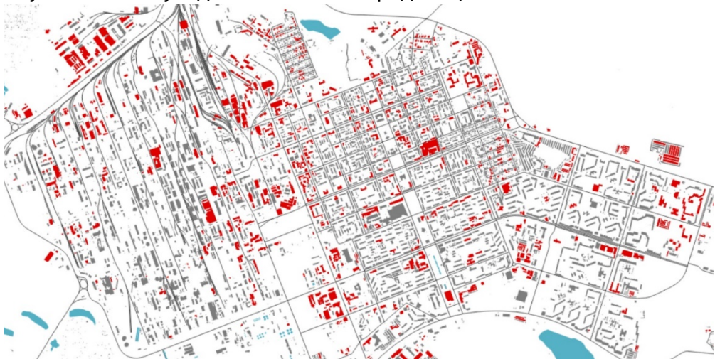
Рис. 1. Карта пожеж внаслідок обстрілів м. Сєвєродонецьк

Залишковий ресурс об'єкта відновлення впливає на рішення щодо доцільності його відновлення або реконструкції. Необхідно визначати рівні та категорії об'єктів відбудови. Це складне методологічне завдання. Однією з умов доцільності відновлення об'єкта є здатність забезпечити певну функцію містобудівної діяльності. На рис. 1 наведено карту пожеж внаслідок обстрілів у м. Сєвєродонецьк. Рис. 2 демонструє знімок інтерактивної карти влучань по місту під час боїв за Сєвєродонецьк.