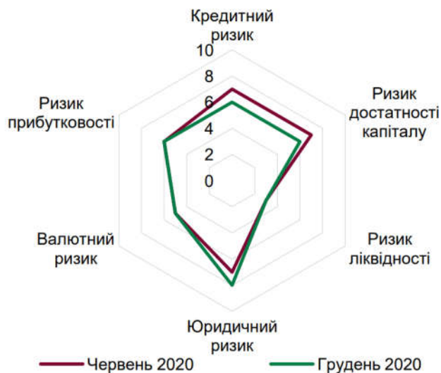
Рис. 2. Карта ризиків банківського сектору [17]

Аналізуючи карту наявних ризиків банківського сектору України (рис. 2), спостерігаємо що незмінністю значень вирізняються ризик ліквідності, валютний ризик та ризик прибутковості. Крім цього, більш впливові ризики – кредитний ризик (відображає перспективи зміни рівня непрацюючих кредитів у портфелях банків та необхідність додаткового формування резервів під такі кредити) та ризик достатності капіталу (оцінює можливості банків забезпечувати достатній рівень капіталу) за даними грудня 2020 року вдалось зменшити у порівнянні з червневими показниками. Оберненою була тенденція щодо рівня юридичного ризику, що визначається на кінець року на максимальному поміж інших показників рівні – 8.