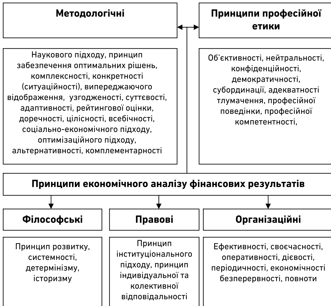
Рисунок. Принципи економічного аналізу фінансових результатів*