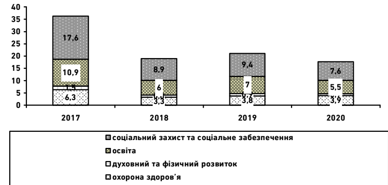
Рис. 3. Показники недофінансування видатків соціального призначення зі зведеного державного бюджету внаслідок податкових втрат від офшоризації економіки, млрд грн

Аналіз показників недофінансування видатків соціального призначення, що зумовлені податковими втратами внаслідок офшоризації економіки, за їх економічною бюджетною класифікацією свідчить (рис. 4), що протягом 2017–2020 рр. можна було б додатково скерувати на оплату праці бюджетників від 9,1 до 46,7 млрд грн, на виплату пенсій і допомог – 23,3 млрд грн, інші соціальні виплати населенню – 19,9 млрд грн.