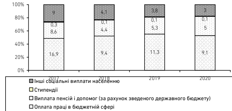
Рис. 4. Показники недофінансування видатків соціального призначення, що зумовлені податковими втратами внаслідок офшоризації економіки, за їх економічною бюджетною класифікацією (млрд грн), 2017–2020 рр.