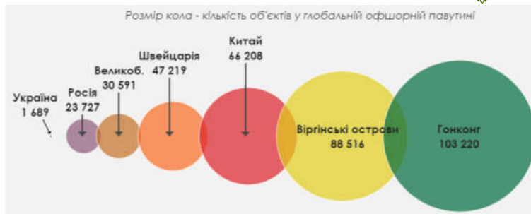
Рис. 1. Місце України в глобальній офшорній мережі

Єдиного підходу до обґрунтування податкових втрат від офшоризації національної економіки немає. Проблемами дослідження фіскального ефекту від застосування різних схем ухилення від оподаткування в Україні займаються експерти Інституту соціально-економічної трансформації. За розрахунками експертів вказаного Інституту протягом 2017–2020 рр. фіскальні втрати України від офшоризації національної економіки є досить значимими (табл. 1). При цьому обсяги офшорних операцій та відповідних фіскальних втрат з 2017 р. суттєво зменшились. Так, якщо у 2017 р. податкові втрати від офшоризації становили 50–65 млрд грн, то у 2020 р. – 15–35 млрд грн, що, безумовно, є позитивним.