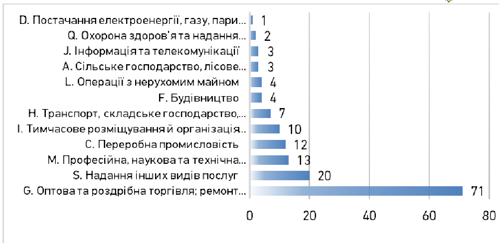
Рис. 1. Розподіл суб'єктів підприємництва за видами економічної діяльності

За структурою організаційно-правових форм суттєво переважають фізичні особи-підприємці, частка яких становить 78% (див. рис. 2). Кожен 5-й респондент представляв юридичну особу.