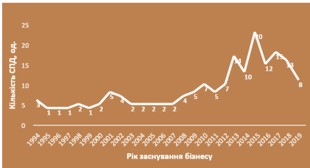
Рис. 3. Розподіл респондентів за віком бізнесу

Загалом свої думки щодо розвитку малого і середнього бізнесу висловили підприємці, що належать до 30-ти розділів КВЕД (див. таблицю).