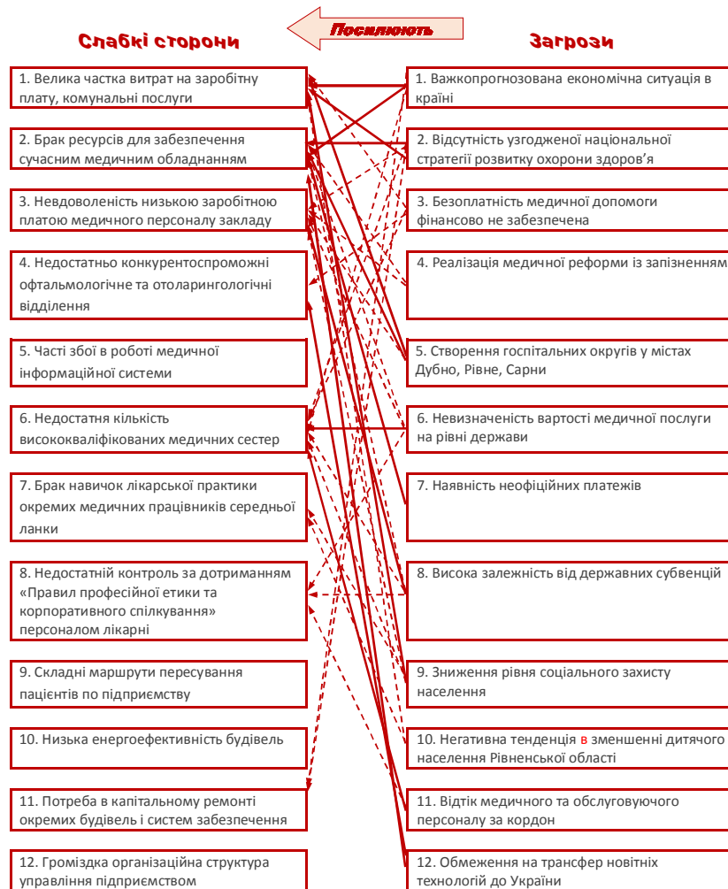
Рис. 3. Ризики КП «РОДЛ»

Грунтуючись на результатах воркшопів робочої групи з розробки Стратегії, колективних засідань персоналу КП «РОДЛ», лікарів-обласних медичних експертів, а також з урахуванням результатів SWOT-аналізу (дозволив визначити головні проблеми лікарні і її конкурентні переваги), було прийнято консенсусне рішення, що місія КП «РОДЛ» має узгоджуватися із загальною місією Рівненської області. Також місія і візія КП «РОДЛ» здобули організаційну легітимність на Колективних зборах працівників лікарні, коли заслуховувалися пропозиції та затверджувався остаточний варіант формулювання цих важливих орієнтирів подальшого стратегічного розвитку.