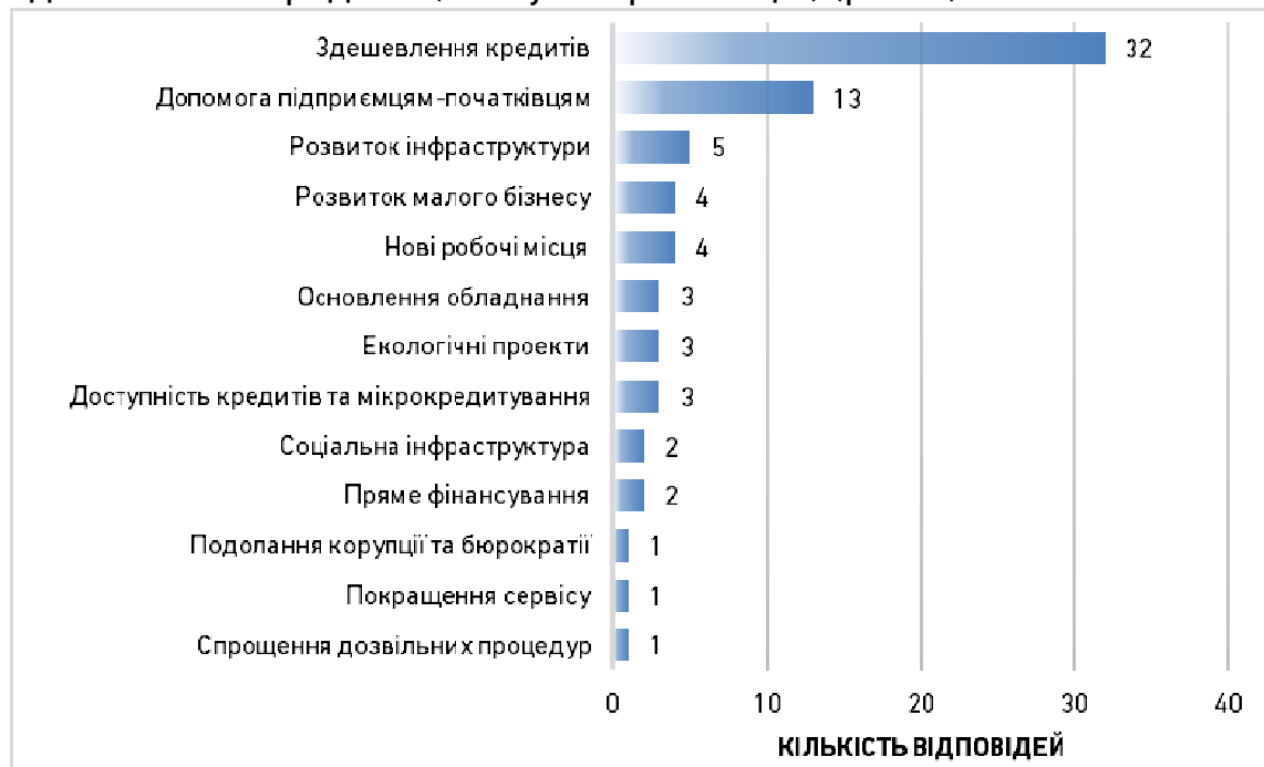
Рис. 2. Пріоритетні напрями фінансової підтримки бізнесу

У результаті опитування представників малого і середнього бізнесу (150 респондентів) в м. Рівне, виявлено, що пріоритетним напрямом фінансової підтримки бізнесу підприємці вважають здешевлення кредитів (23% усіх пропозицій) (рис. 2).