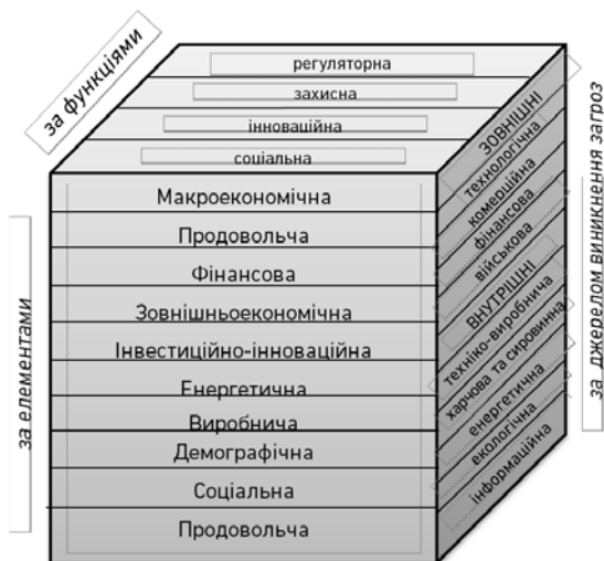
Рис. 2. Структура економічної безпеки держави узагальнено на підставі [4] та доповнено авторами

Узагальнення підходів до елементів економічної безпеки держави дозволяє сформуванню комплексне бачення її структурування (рис. 2).