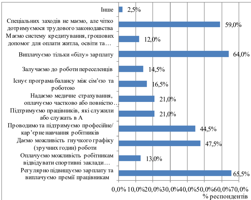
Рис. 1. Заходи для персоналу компаній в Україні

Водночас все більшої популярності набувають різноманітні програми соціального благополуччя, що реалізуються у компаніях України (рис. 2).