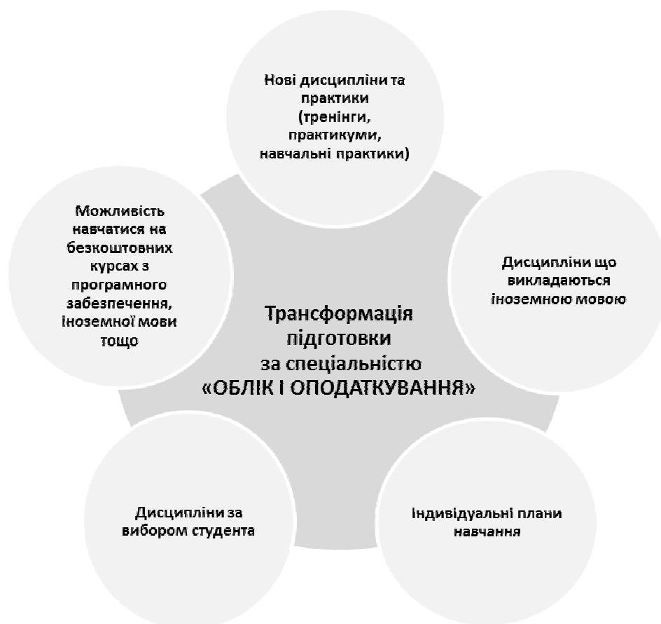
Рис. 2. Основні напрями трансформації підготовки здобувача за спеціальністю «Облік і оподаткування» у сучасному середовищі

Висновки. Таким чином, найсуттєвішими трендами у сучасній освіті, і зокрема професійній бухгалтерській, є: дистанційне навчання, широка співпраця університетів і бізнесу, білінгвальність. Вирішення описаних проблем можливе завдяки впровадженню наступних концепцій: гармонійного поєднання навчання з роботою; запровадження гнучких систем навчання.