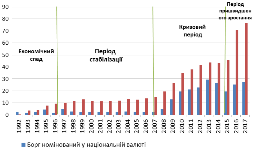
Рис. 1. Динаміка державного боргу по валютах

внутрішніх державних запозичень. Як наслідок, у 2004–2005 рр. борговий тиск на економіку зменшився, кредитний рейтинг України підвищився до В+ зі стабільним та позитивним прогнозом. Україна отримала доступ до міжнародних фондів ринків і почала розміщувати єврооблігації за ставками 7–9% річних. Кон'юнктура світового ринку сировини була сприятливою, що дозволило значно знизити частку боргу у ВВП.