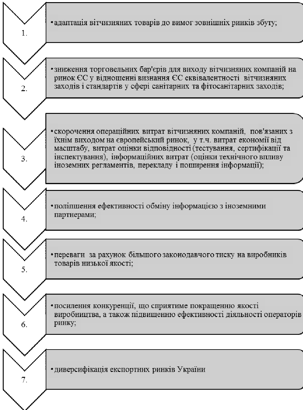
Рис. 1. Виклики вітчизняному експорту продукції харчової промисловості

Динаміку експорту та імпорту молока та молочної продукції України протягом 2012–2017 років представлено на рис. 2.