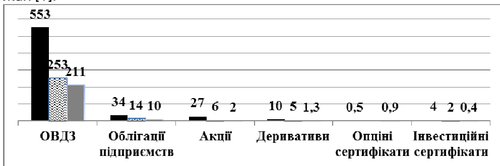
Рис. 2. Обсяги торгів на біржовому фондовому ринку України за видами цінних паперів в 2011–2016 рр., млрд грн (розроблено автором на основі [1])

Організований ринок за структурою обсягів торгів в розрізі фінансових інструментів фактично є ринком державних облігацій (94% загального обсягу) (рис. 2). Характерним є те, що у 2016 році зменшились торги державними цінними паперами, але у порівнянні з іншими інструментами, зменшення було несуттєвим. Обсяг торгів акціями збільшився більш ніж вдвічі, деривативами – в 4 рази, інвестиційними сертифікатами – в 5 разів. Що стосується торгівлі акціями, то 99,5% загального обсягу торгів з акціями відбувається на позабіржовому ринку. Найбільш активно на позабіржовому ринку торгуються цінні папери, торгівля якими була зупинена на фондових біржах [1].