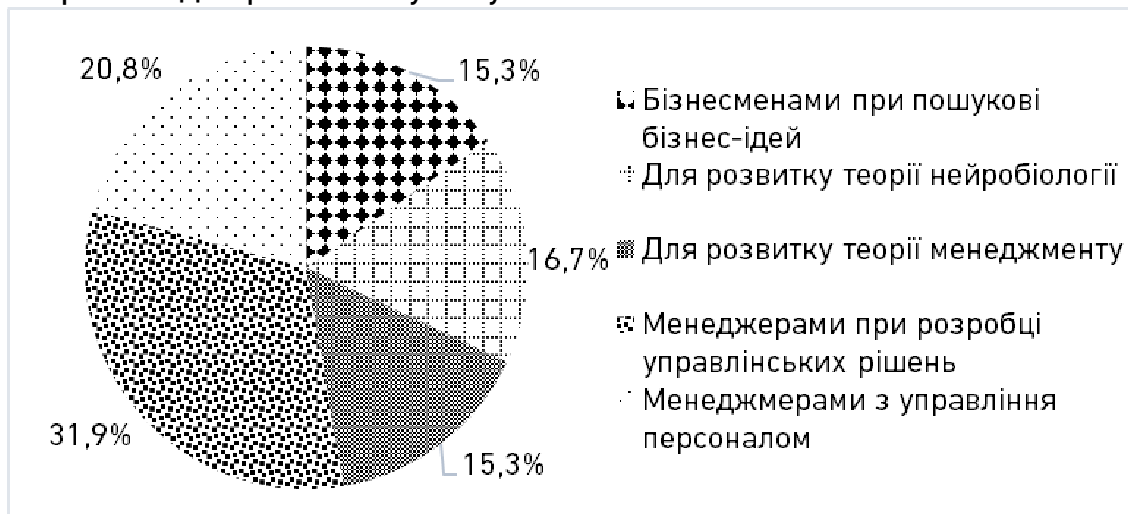
Рис. 3. Основні напрямки використання знань про нейроменеджмент

вважають, що це керівник, який приймає УР на засадах логічного мислення. Однак, тільки 11% респондентів переконані, що нейроменеджерами можуть бути бізнесмени.