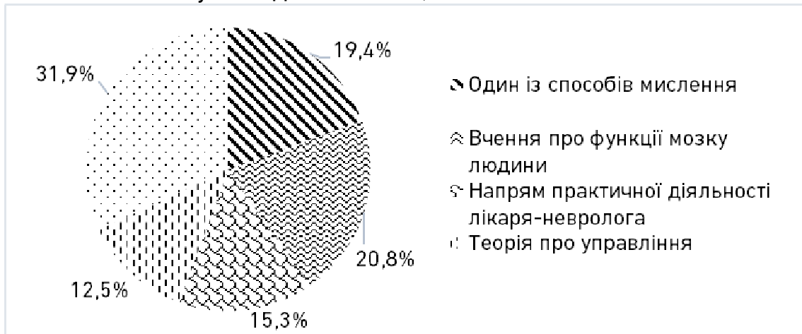
Рис. 2. Динаміка факторів, що характеризують нейроменеджмент як науку і практику управління

Інші відповіді на поставлене запитання, що... «нейроменеджмент – це наука, заснована на...» використанні досягнень нейробиології та інтелекту бізнесмена було оцінено респондентами в межах 18%, на це ж питання відповідь, що... «це наука, заснована на вченні про когнітивне мислення» набрала менше 10%.