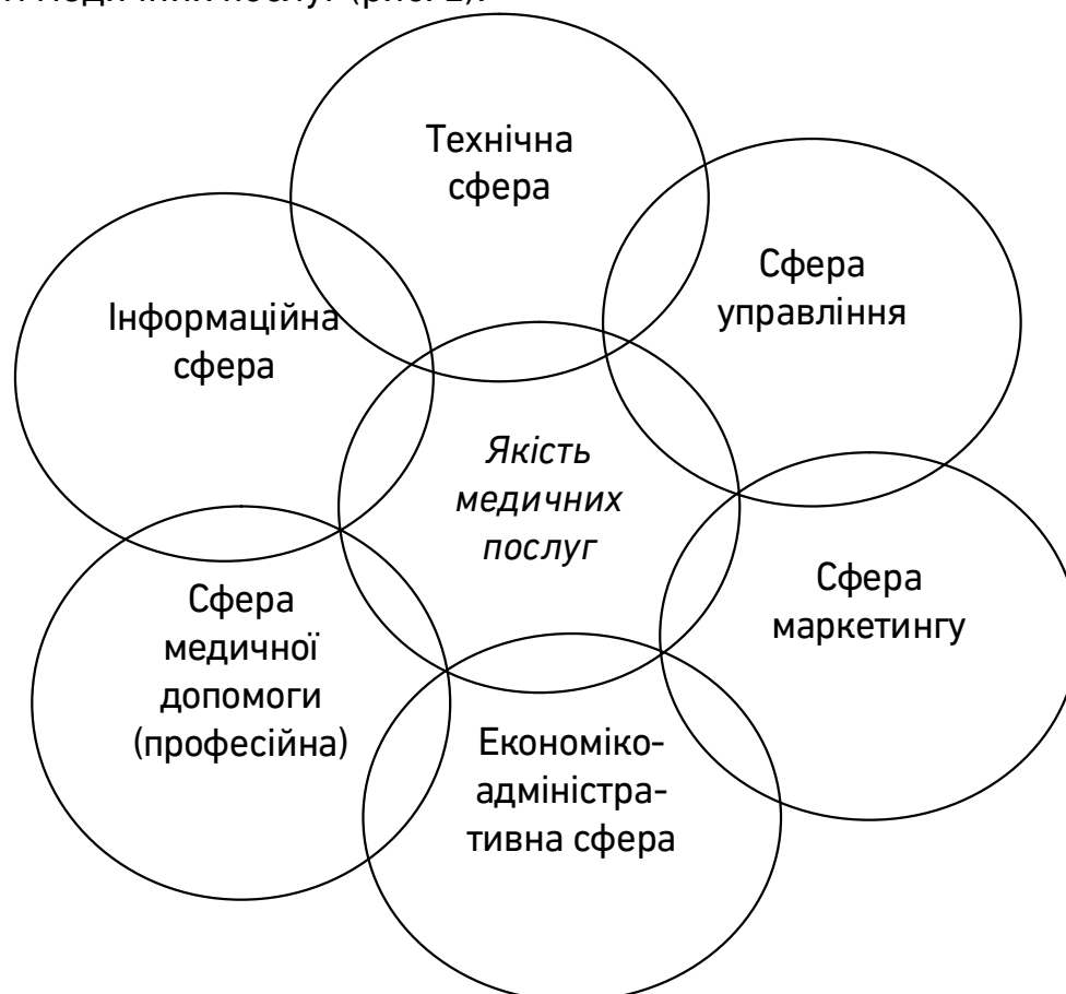
Рис. 2. Сфери забезпечення якості медичних послуг в закладах охорони здоров'я

Медична послуга має досить різнобічну структуру. Тому, оцінюючи якість такої послуги, слід брати до уваги як медичні, так і немедичні аспекти, які на неї впливають. Науковці виділяють наступні сфери, які здійснюють найбільший вплив на формування якості медичних послуг (рис. 2):