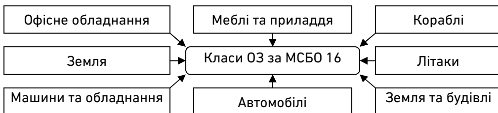
Рис. 2. Класи основних засобів згідно з МСБО 16

Отже, за П(С)БО 7, основні засоби поділені на групи, які узагальнюють вид того чи іншого основного засобу. МСБО 16 більш детально виокремлює види основних засобів: кораблі, літаки, автомобілі, які в П(С)БО 7, об'єднані в групу «транспортні засоби». Окрім цього, в міжнародному стандарті взагалі не виділяється така група основних засобів, як тварини або багаторічні насадження.