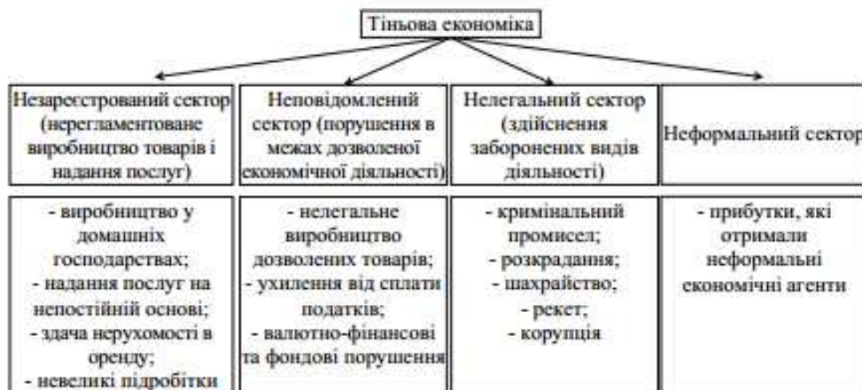
Рис. 1. Класифікація секторів тіньової економіки

Такий підхід дозволяє визначати мотиви учасників тіньової економіки, ступінь загрози для офіційної економіки, пріоритети детінізації для кожного із секторів та розробляти ефективні її механізми.