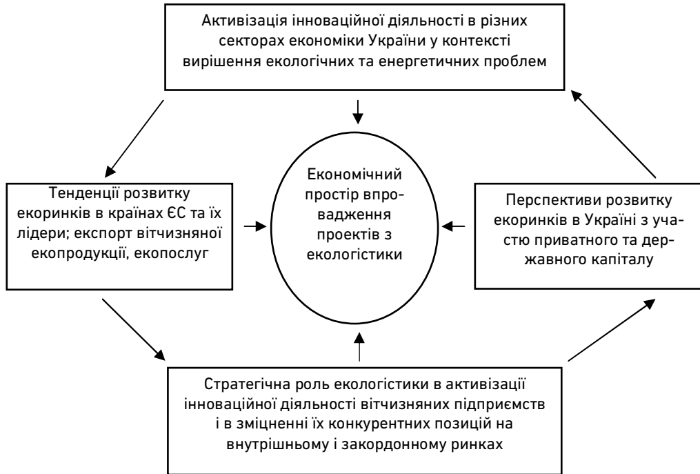
Рис. 4. Розвиток екологістики як неперервний взаємообумовлений процес активізації інноваційної діяльності підприємницьких структур під тиском критичних факторів виробництва

У сукупності і взаємодії всі регульовальні заходи розвитку національних економік, що визначали напрямки екологічної орієнтації логістики, дозволили якісно змінити її функціональне навантаження і стратегічне значення в процесах створення вартості та суспільних цінностей.