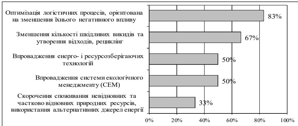
Рис. 1. Частка компаній, які реалізують екологічні заходи з метою зменшення негативного впливу на середовище та його захисту