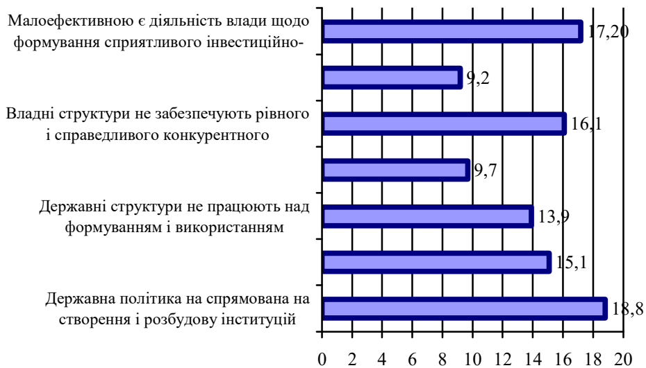
Рис. 2. Результати оцінювання недоліків системи державного регулювання формування і розвитку інвестиційно-інноваційного забезпечення економічної безпеки економіки Львівської області, станом на 2016 р., (розраховано за результатами експертного опитування)

жавного регулювання формування і розвитку інвестиційно-інноваційного забезпечення економічної безпеки держави (рис. 2) зроблено наступні висновки.