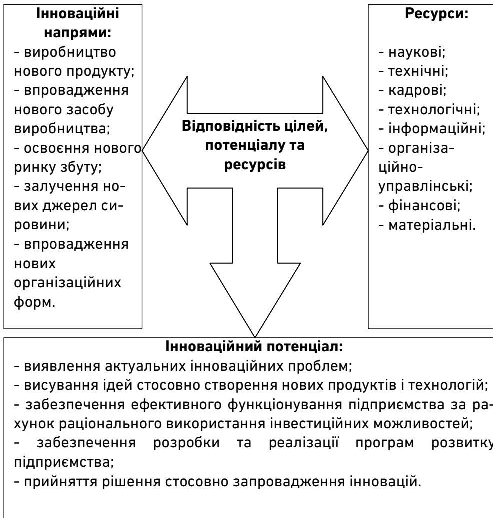
Рис. 2. Формування інноваційного розвитку будівельного підприємства у взаємодії інноваційного потенціалу та ресурсної бази [авторська розробка]

класифікацією інновацій, розробленою Й. Шумпетером [10]), інноваційного потенціалу та ресурсної бази будівельного підприємства подано на рис. 2.