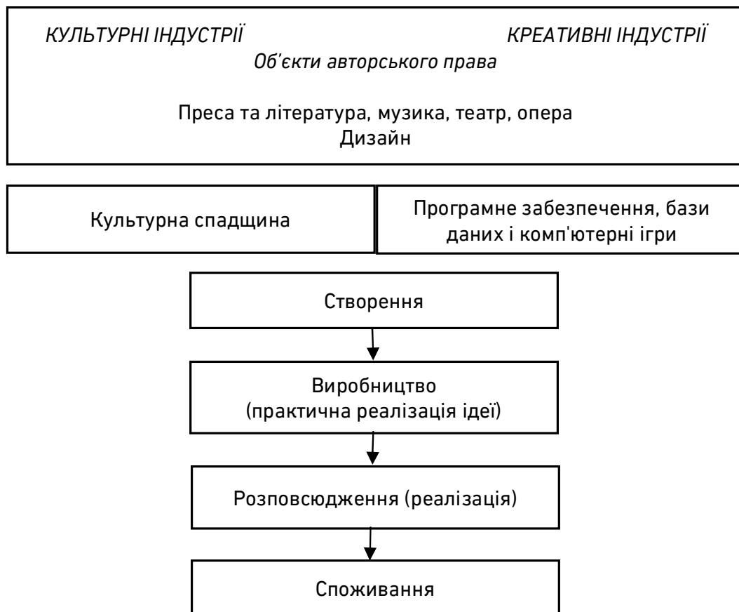
Рис. 1. Сутність креативних індустрій

У звіті Всесвітньої організації інтелектуальної власності «Як заробляти на життя у креативних індустріях» термін «креативна індустрія» трактується через взаємозв'язок з «культурною індустрією» (рис. 1).