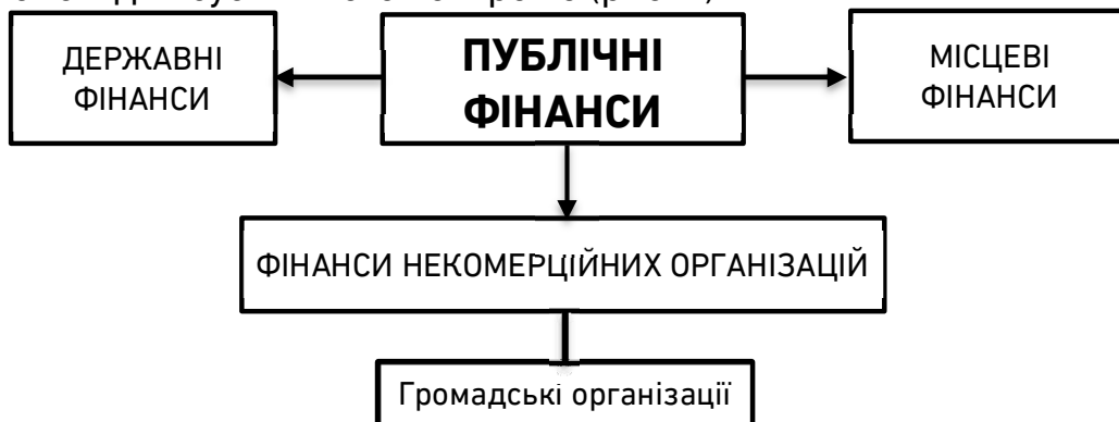
Рис. 2. Місце фінансів громадських організацій у публічному секторі*

Таким чином, конкретна роль громадських організацій у фінансовій системі залежить від їх позиції в системі: держава – бізнес – суспільство. За рахунок некомерційного сектору встановлюється та зміцнюється соціальний баланс, створюється відповідальне громадянське суспільство та надається широкий спектр соціальних послуг. Відповідно фінанси громадських організацій як частина фінансів некомерційних організацій в структурі фінансової системи країни разом з державними і місцевими фінансами формують сферу публічних фінансів, тобто фінансів для суспільного контролю (рис. 2).