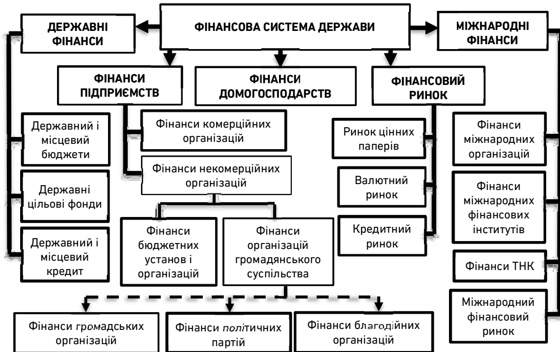
Рис. 1. Місце фінансів громадських організацій у фінансовій системі держави*

*Джерело: складено автором на основі [5; 6; 7]