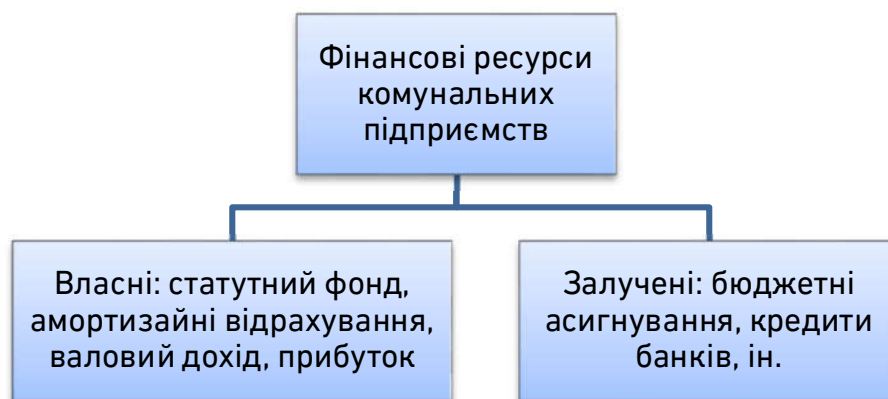
Рис. 2. Види фінансових ресурсів комунальних підприємств

Фінансові ресурси комунальних підприємств – це сукупність коштів, резервів і доходів, які наділені правом підприємства оперативного управління або цілісного господарського управління та використовуються для власних потреб (рис. 2). Відповідно фінансова підтримка комунальних підприємств – це багатопрофільний процес, який включає різноманітні джерела надходжень та фінансування.