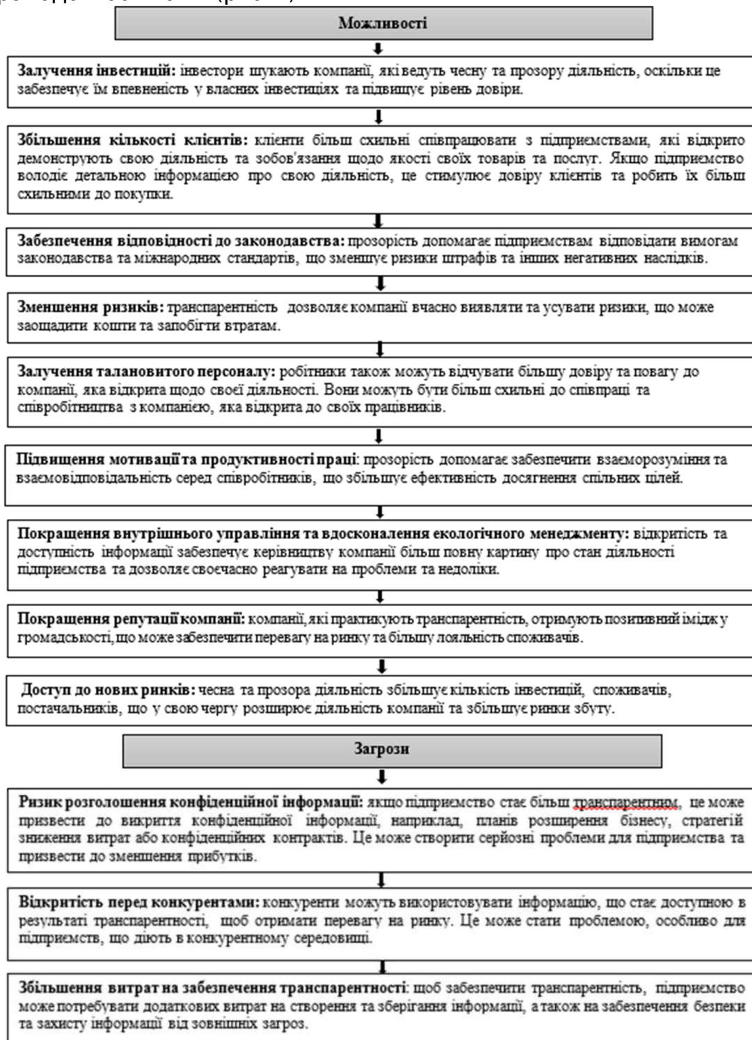
Рис. 4. Можливості та загрози транспарентної діяльності підприємства

своєчасно реагувати на проблеми та недоліки; компанії, які практикують транспарентність, отримують позитивний імідж у громадськості та ін. (рис. 4).