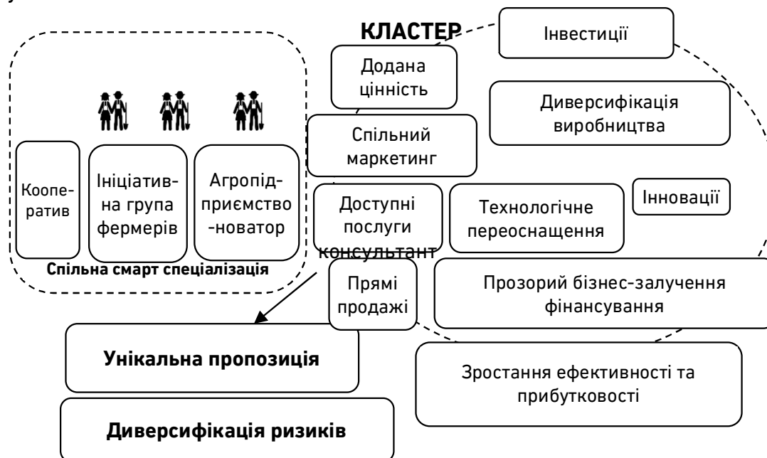
Рис. 3. Основні складові об'єднання виробників у кластер, що підлягає оцінці у проектах грантових запитів

необхідною детермінантою забезпечення економічного зростання країн, а для України – інструментом розвитку (відродження) держави у після військовий час.