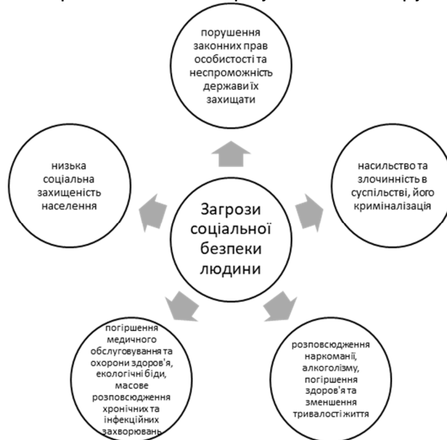
Рис. 2. Джерела загроз соціальній безпеці людини

реалізацію життєво важливих інтересів особи, суспільства та держави для забезпечення стійкого і прогресивного розвитку країни [18]. Загрози соціальної безпеки представляють собою явища та процеси, які спричиняють раптові, а часом і суттєві зміни в способі життя, порушують життєво важливі соціальні права та інтереси особи. Джерела таких загроз можна класифікувати на такі групи (рис. 2).