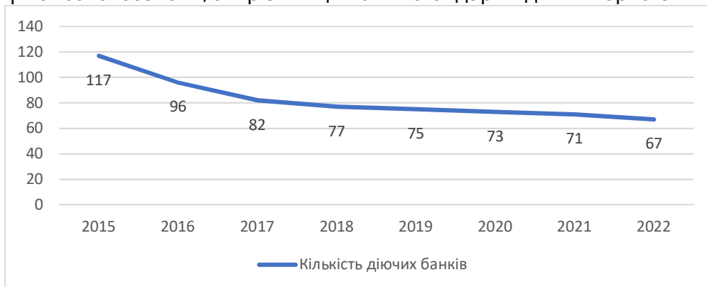
Рис. 3. Кількість діючих банків в Україні за 2015–2022 роки

Аналіз показав, що хоча кількість банків скоротилася до 67 у 2022 році (рис. 3), банківський сектор працює стабільно, незважаючи на напад Росії. Комплексна оцінка рівня фінансової безпеки банків повинна враховувати поточний стан справ і майбутній розвиток їх різноманітних операцій. Однак існують відмінності в наукових методах, які використовуються НБУ та іншими фінансовими установами та незалежними експертами для моніторингу їх операцій, які вимагають не лише різних наборів показників для оцінки фінансової безпеки, а й різних цільових стандартів для використання.