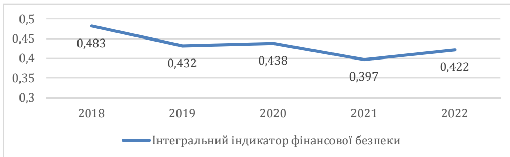
Рис. 4. Інтегральний індикатор фінансової безпеки банків України за 2018–2022 роки