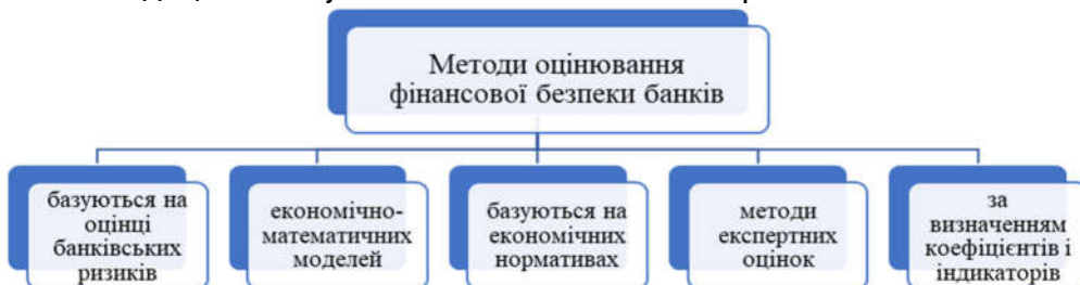
Рис. 2. Групи методів оцінювання фінансової безпеки банків

Розглядаючи кількісні показники, які мають фінансову складову, для визначення загроз чи проблем при оцінці методів фінансової безпеки доцільно їх узагальнити таким чином (рис. 2).