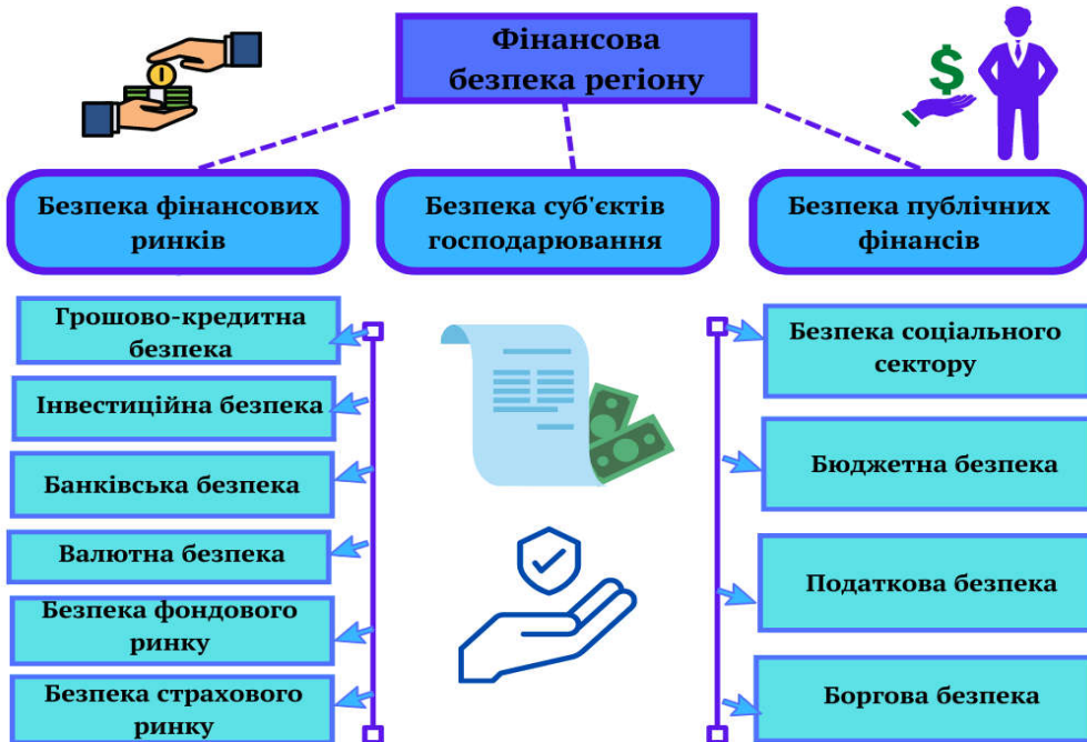
Рис. 3. Структура фінансової безпеки регіону *

* Джерело: складено автором на основі [10; 3; 6; 1]