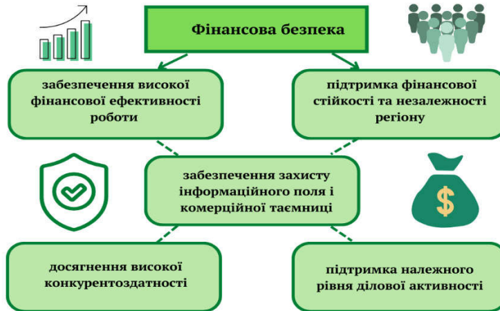
Рис. 1. Основні цілі забезпечення фінансової безпеки регіону*

Основні цілі забезпечення фінансової безпеки регіону включають (рис. 1): підтримку фінансової стійкості та незалежності регіону; фінансову ефективність роботи; захист інформаційного поля та комерційної таємниці; досягнення конкурентоздатності регіону; підтримку належного рівня ділової активності.