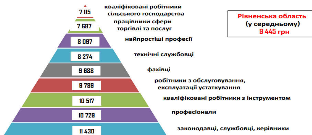
Рис. 2. Заробітна плата у вакансіях за професійними групами станом на 1 листопада 2023 року, грн [2]

В Рівненській області розмір середньомісячної зарплати за вакансіями, які пропонувалися, склав 9445 грн (рис. 2). Однак, цей розмір є різними для різних професій та галузей. Відтак, найбільший розмір заробітку спостерігається у службовців, керівників, робітників з обслуговування експлуатації устаткування, а саме 10–11 тис. грн. Дещо менше, зокрема 9680–10700 грн – фахівцям, професіоналам та кваліфікованим робітникам. Всім іншим професійним групам оплата праці становить 7100–8300 грн.