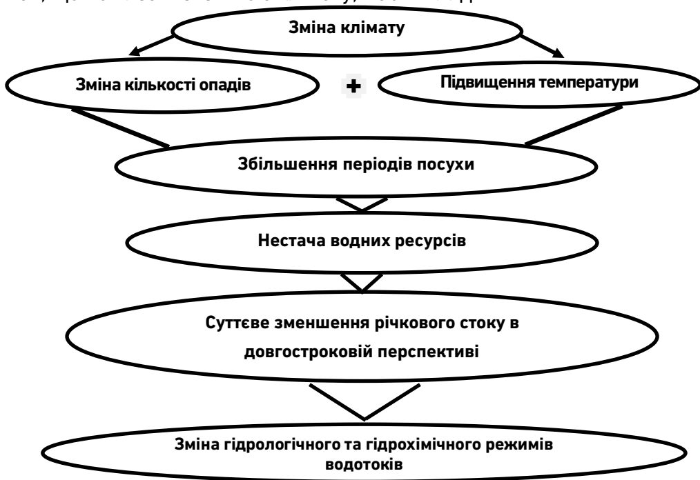
Рис. 1. Вплив зміни клімату на водні ресурси

Отже, ланцюжок можливих трансформацій у водних екосистемах, що пов'язані зі зміною клімату, має вигляд: