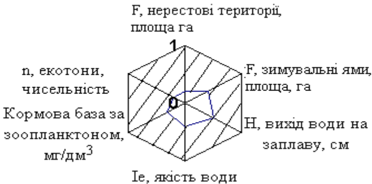
Рис. 3. Стан трансформованих екосистем р. Горинь у верхній течії (за роботою Войтишиної Д.Й.)

* В чисельнику – оптимальна кількість врахованих екотонів до антропогенних змін, в знаменнику – фактична.