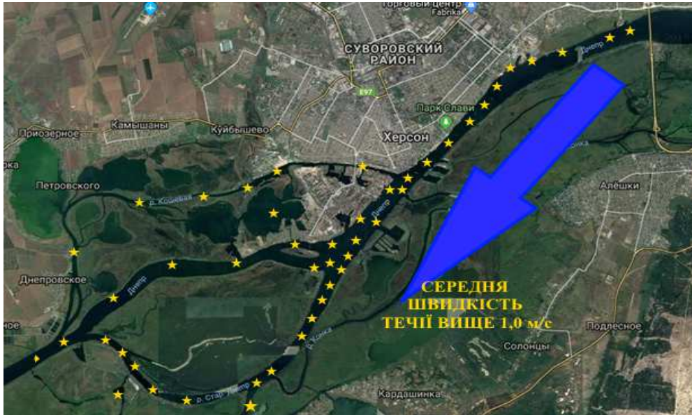
Рис. 2. Гідрологічна структура розподілу вод поверхневого стоку з території міста Херсон в акваторії Дніпра в зимово-весняний період