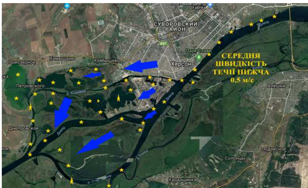
Рис. 3. Гідрологічна структура розподілу вод поверхневого стоку з території міста Херсон в акваторії Дніпра в літньо-осінній період

Останні роки, за рахунок суттєвого зменшення відбору води на потреби Північно-Кримського каналу водонаповненість Дніпра в його нижній частині відчутно зросла, що знайшло своє відображення в поліпшенні стану гідроекосистеми ріки, прирічкових плавневих озер і навіть Дніпро-Бузького лиману. Особливо помітною на фоні стійкої