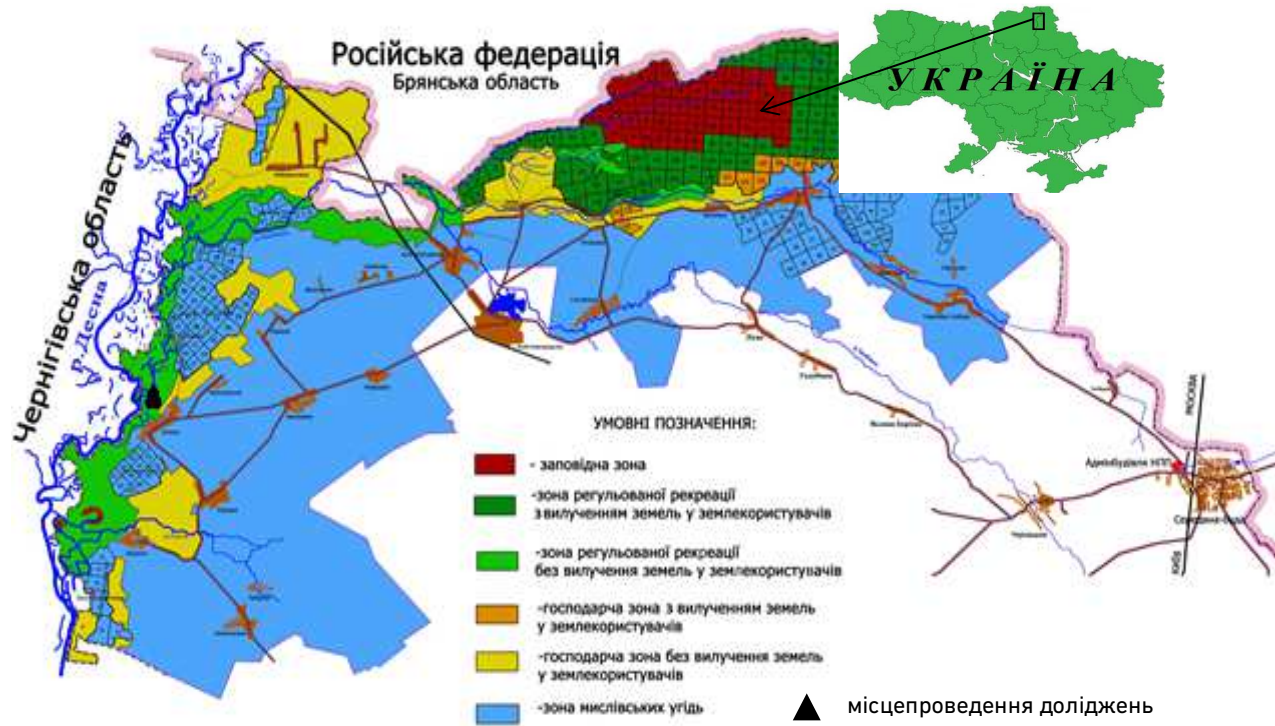
Рис. 1. Схема функціонального зонування НПП «Деснянсько-Старогутський» [2] та місце розміщення еталонного створу досліджень