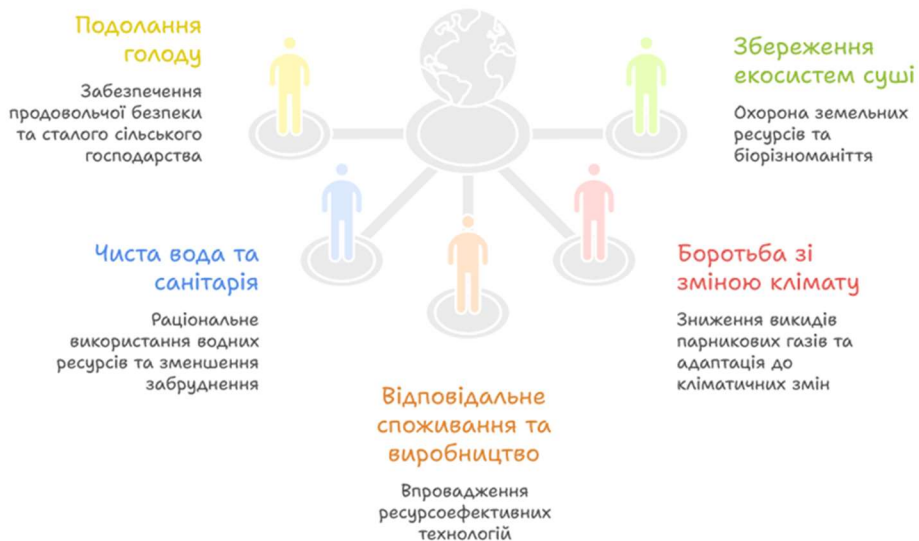
Рис. 1. Зв'язок органічного виробництва з Цілями сталого розвитку

Не менш важливим є внесок органічного виробництва у реалізацію ЦСР 15 «Збереження екосистем суші», яка передбачає охорону земельних ресурсів, збереження біорізноманіття та відновлення деградованих екосистем. Органічне господарювання сприяє відновленню природних екосистем, підвищенню біологічного різноманіття та зменшенню деградації ґрунтів, що є важливим фактором екологічної стійкості територій [5] (рис. 1).