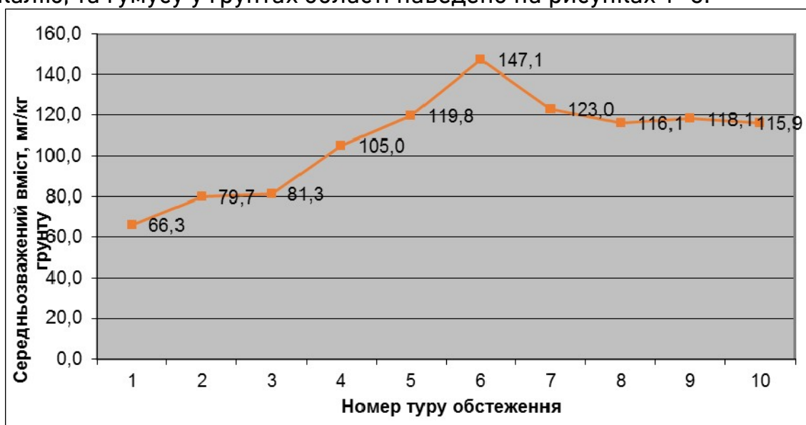
Рис. 1. Динаміка середньозваженого вмісту рухомих сполук фосфору у ґрунтах Волинської області

Багаторічну динаміку вмісту рухомого фосфору, обмінного калію, та гумусу у ґрунтах області наведено на рисунках 1–3.