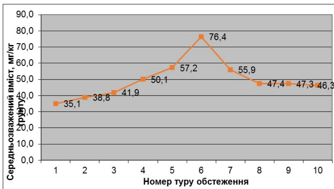
Рис. 2. Динаміка середньозваженого вмісту обмінного калію у ґрунтах Волинської області

У 2010–2020 роках внесення мінеральних добрив дещо зросло – до 170–190 кг діючої речовини на га (причому понад 70% – азотні добрива), а органічних ще знизилось – до 1,3–1,8 т/га.