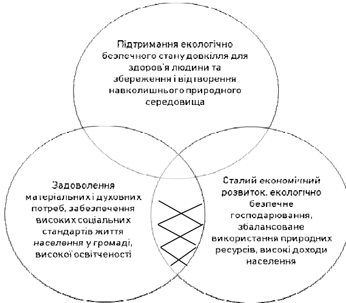
Рис. 2. Пріоритети забезпечення досягнення Стратегічного бачення Городоцької СР