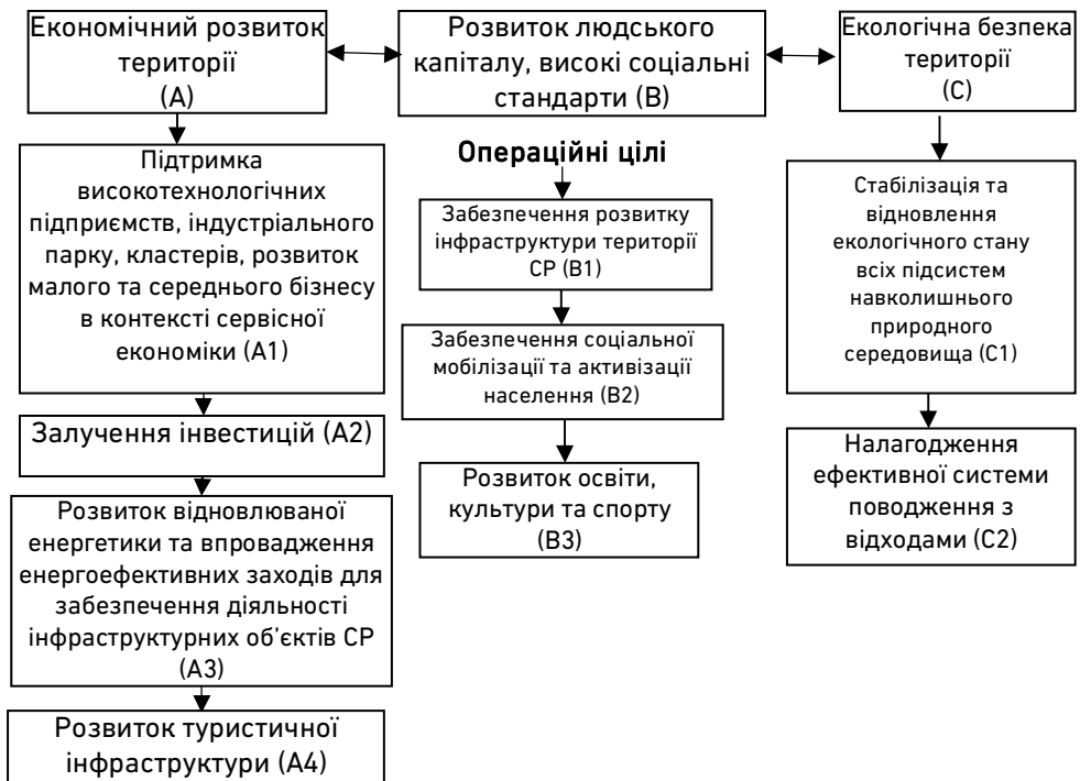
Рис. 3. Дерево цілей Городоцької СР